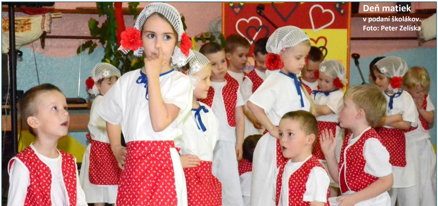
Deň matiek v podaní školákov.

Aktuálna téma: užitočné tipy pre bezstarostné leto