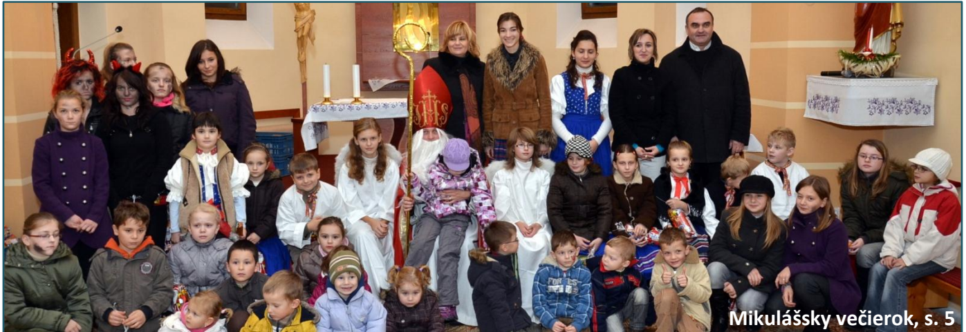
Mikulášsky večerok, s. 5