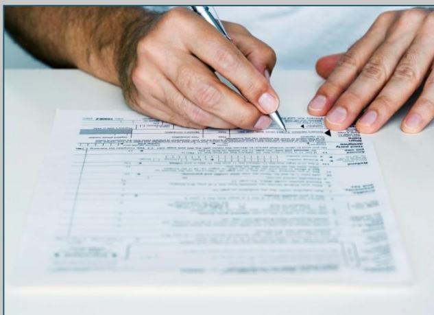
DANA SUCHÁ, Foto: ilustračné

Bližšie informácie na tel. č.: 032/6597295 alebo e-mailom na: obecporuba@mail.t-com.sk .