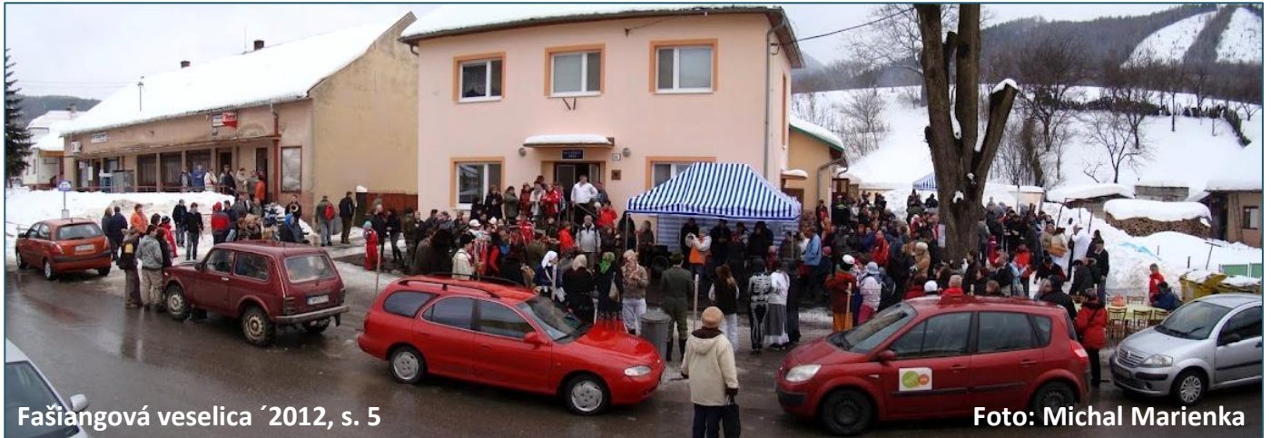
Fašiangová veselica '2012, s. 5