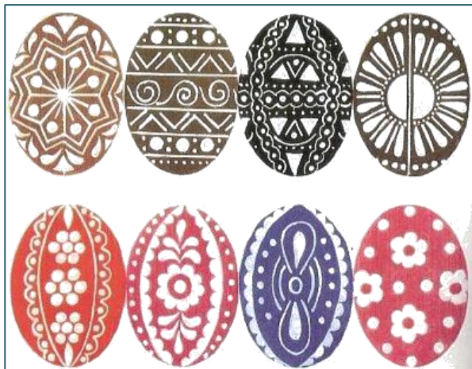
Leptané kraslice z Dolnej Poruby.

rukoväťou a farebnými stužkami. Podľa tradície muži pri hodovaní prednesú koledy. V minulosti sa zvyčajne používala iba jedna metóda. Na strednom a západnom Slovensku väčšinou korbáčovanie a na východe polievanie. Šibačka aj oblievačka vychádzajú z rovnakých pohanských predstáv. Voda aj vrbové prúty totiž symbolizujú sviežosť a dievčatám majú zabezpečiť plodnosť.