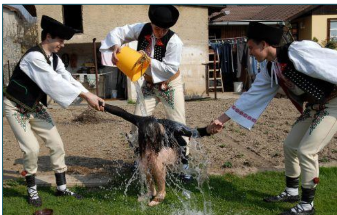
Tradičná slovenská oblievačka.

Na Veľkonočný pondelok je prastarou tradíciou hodovanie, polievanie a tzv. korbáčová šibačka. Od rána muži a chlapci navštevujú domácnosti svojich známych a polievajú alebo korbáčujú ženy a dievčatá ručne vyrobeným korbáčom z vrbového prútia. Korbáč je spletený z 8, 12 alebo až 24 prútov a je zvyčajne od pol do dvoch metrov dlhý a ozdobený pletenou