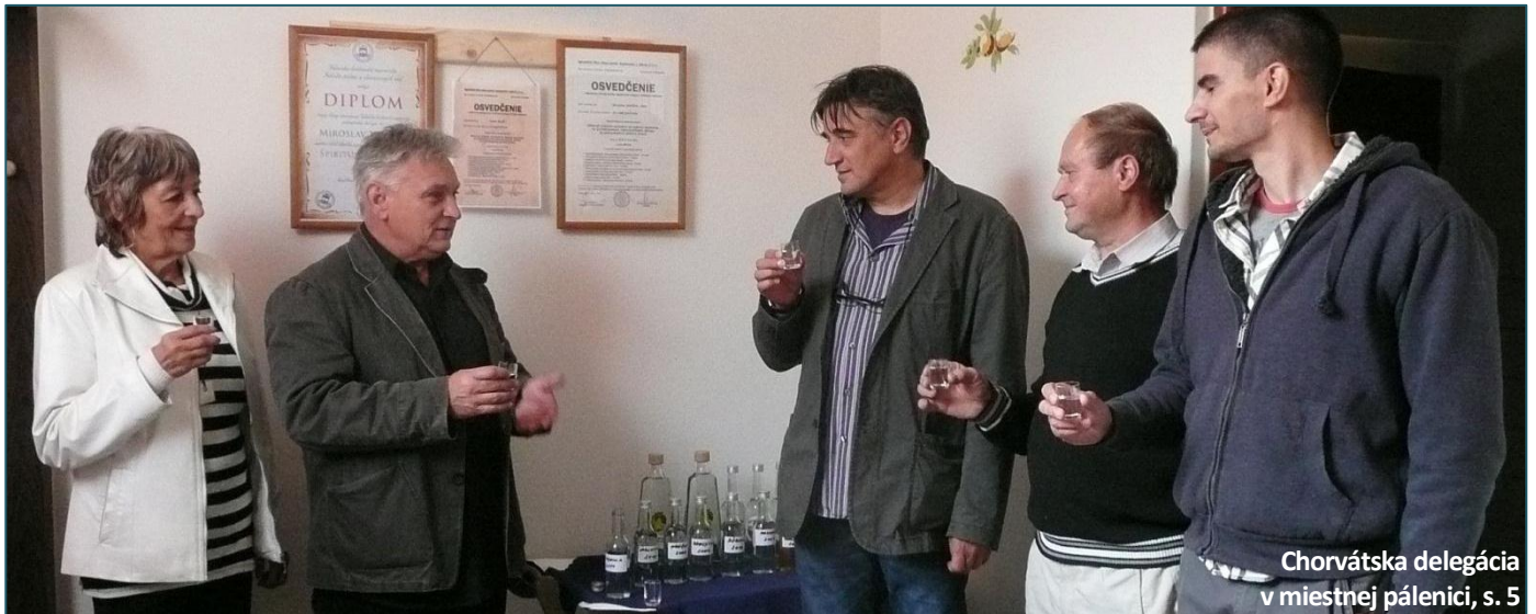
Chorvátska delegácia v miestnej pálenici, s. 5