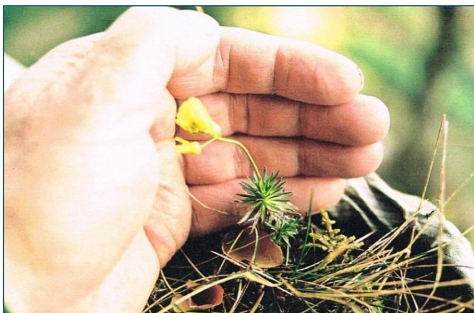
CHUDÔBKA – jeden zo symbolov Dolnej Poruby. Rastie na skalných vežiach, jej zriedkavosť naznačuje samotný názov. Jedna z prvých kvitnúcich jarných rastlín v horách. Obľúbená alpínka.

Doma zametáme, vysávame, umývame, no pri vychádzkach do prírody robíme neporiadok. Stavíme rozhľadne, cyklotrasy, náučné chodníky, no