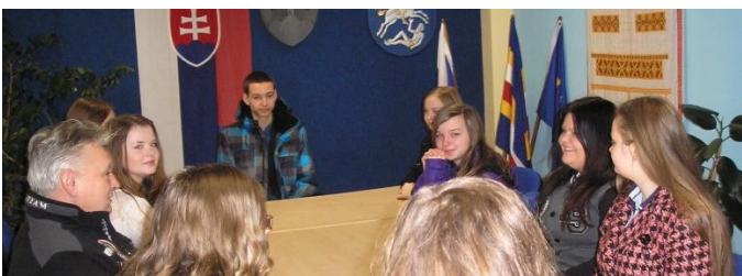
Návšteva žiakov 9. ročníka na obecnom úrade (19. 12. 2014)

Svojou kreativitou dokázali deti materskej školy spolu s rodičmi premeniť škôlku na Tekvičkovo a vôňa vlastnoručne upečených medovníčkov