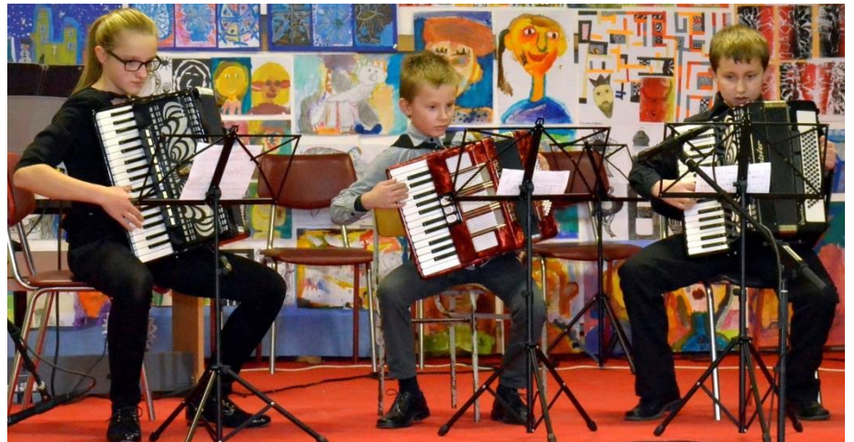
V Omšeni sa konal 13. 12. 2015 vianočný koncert, na ktorom vystupovali aj žiaci z Dolnej Poruby. Plná sála svedčila o záujme rodičov a ďalších rodinných príslušníkov. Deti v paráde predvedli, čo sa naučili v tamojšej základnej umeleckej škole.