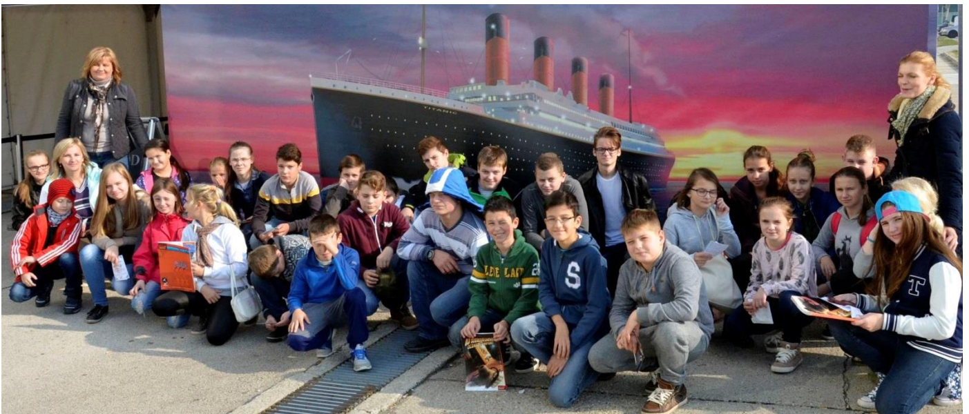
Začiatkom novembra navštívili žiaci našej základnej školy výstavu TITANIC v areáli Incheby v Bratislave. Obdivovali fotografie z čias výstavby „nepotopiteľnej“ lode a tiež predmety vyložené z miesta jej potopenia. Potom deti navštívili Bratislavský hrad a Dóm sv. Martina. Texty a foto: PETER ZELÍSKA