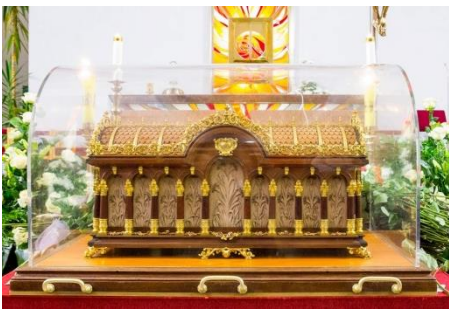
Na Slovensko prišli telesné pozostatky Svätej

Terézie (1873–1897), jednej z najväčších svätíc z Francúzska, ktorá bola vyhlásená za učiteľku cirkvi. Putovanie relikvie sa uskutočnilo na záver Roka zasväteného života na Slovensku. Vystavené boli od 10. do 24. 1. 2016 vo vybraných kostoloch v jednotlivých mestách. Telesné pozostatky zavítali 22. januára 2016 na krátku chvíľu aj do nášho krajského mesta Trenčín, do Kostola sv. Rodiny na sídlisku Juh. Telesné pozostatky boli uložené v drevenej pozlátenej truhle s hmotnosťou 123 kg za nepriestrelným sklom. Relikviár prenášali šiesti ľudia.