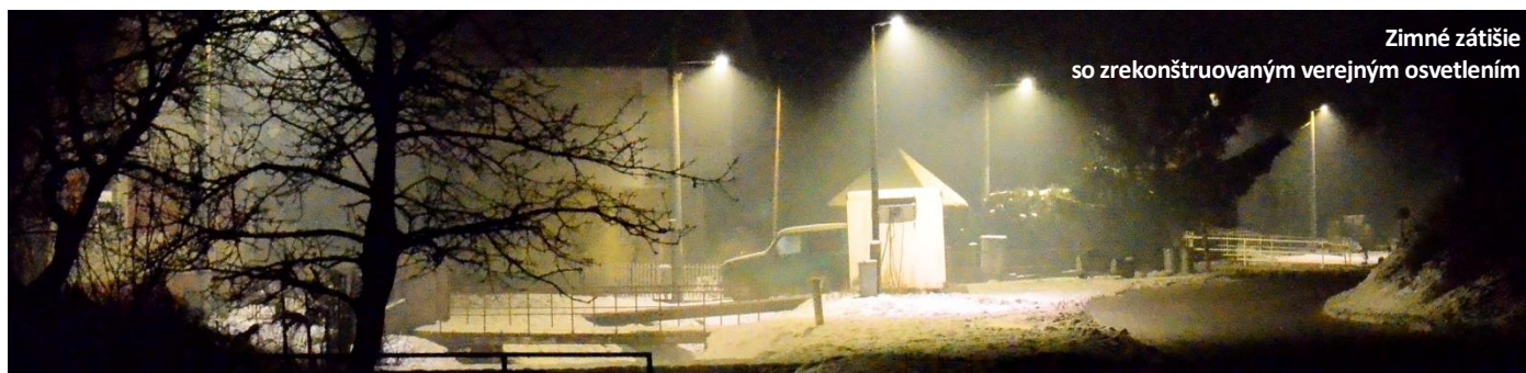
Zimné zátiešie so zrekonštruovaným verejným osvetlením