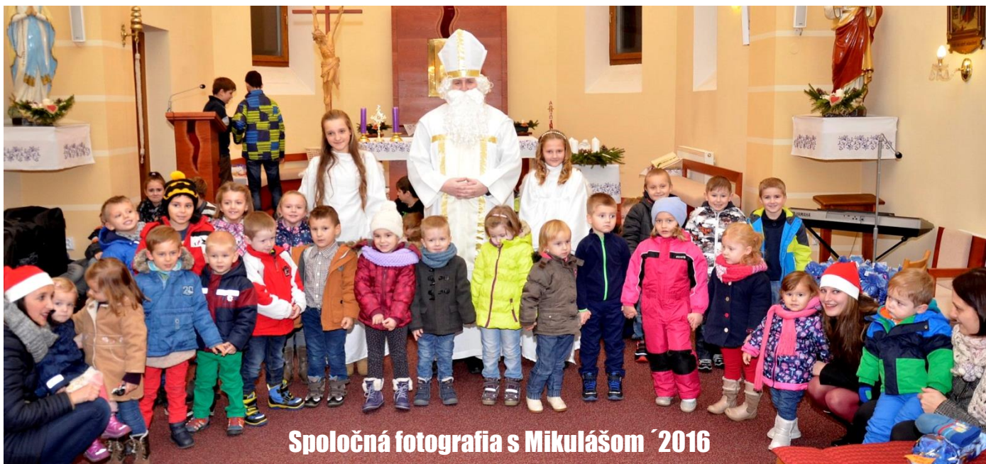
Spoločná fotografia s Mikulášom 2016