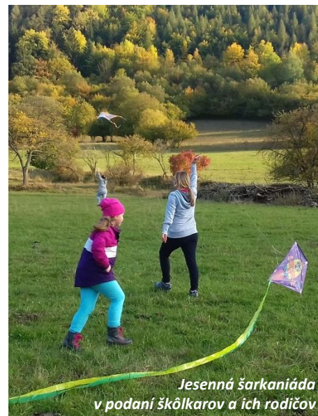
Jesenná šarkaniáda v podaní škôlkarov a ich rodičov