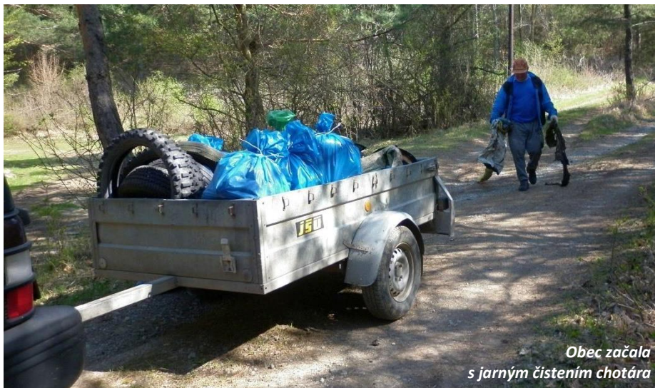
Obec začala s jarným čistením chotára