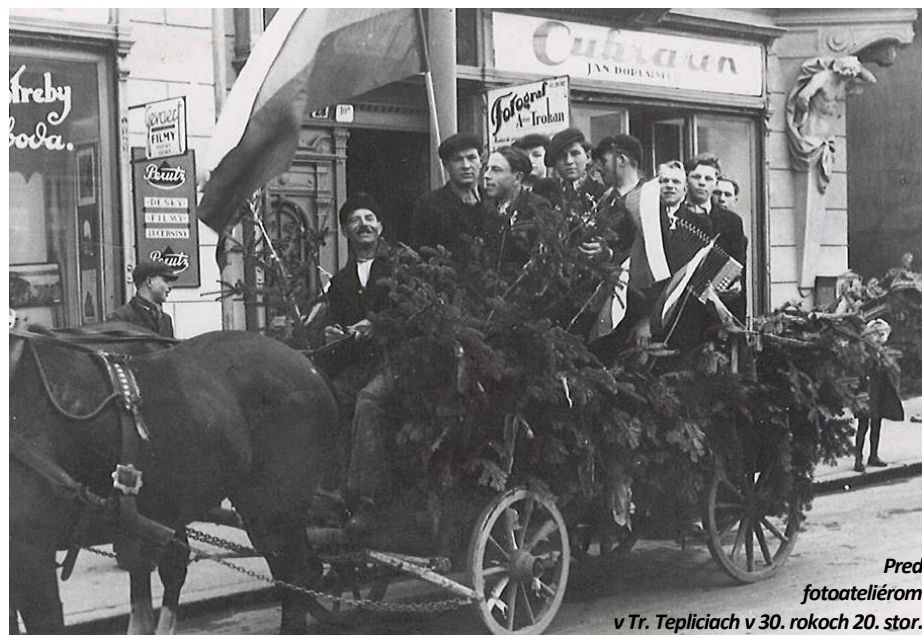
Pred fotoateliérom v Tr. Tepliciach v 30. rokoch 20. stor.