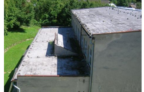
Stav strechy telocvične pred a po rekonštrukcii

So začiatkom nového školského roka sa modernizácie dočkala aj telocvična pri budove miestnej základnej školy. Zo štátnej dotácie vo výške cca. 72 000 eur sa podarilo vymeniť starý strešný plášť aj plastové okná. PM; Foto: STROJSTAV