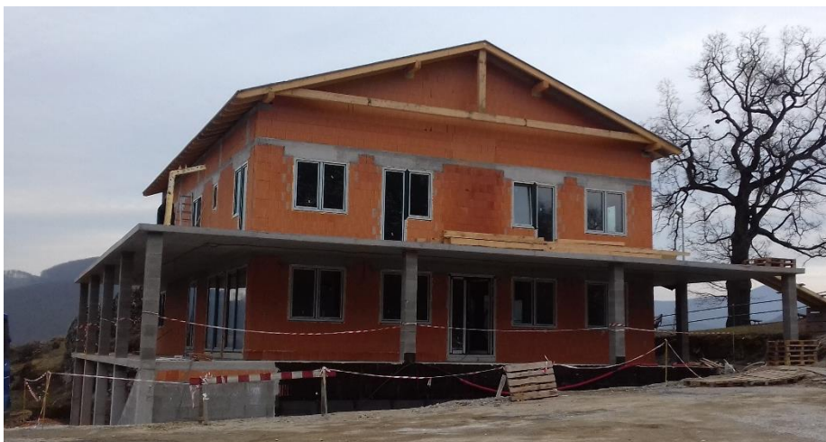
▲ Stav výstavby na Malej Skalke z prelomu februára a marca 2019