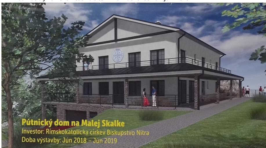
Pútnický dom na Malej Skalke

Investor: Rímskokatolícka cirkev Biskupstvo Nitra