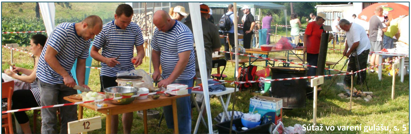
Súťaž vo varení gulášu, s. 5