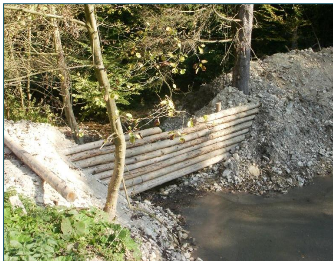
Protipovodňová hrádza v lokalite Hlboká