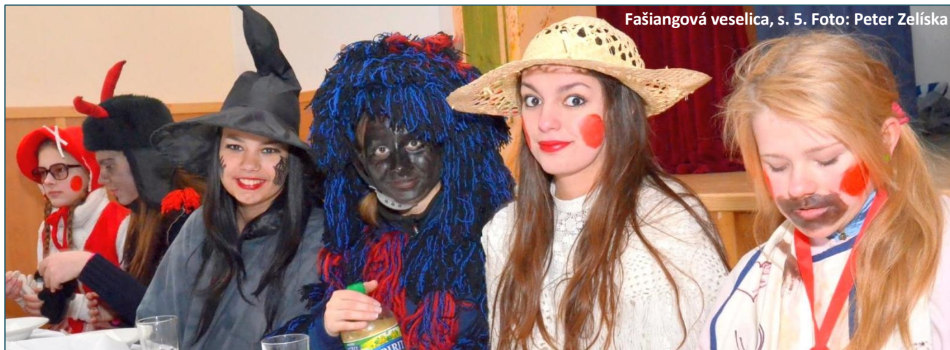
Fašiangová veselica, s. 5.

Uznesenia zo zasadnutia obecného zastupiteľstva