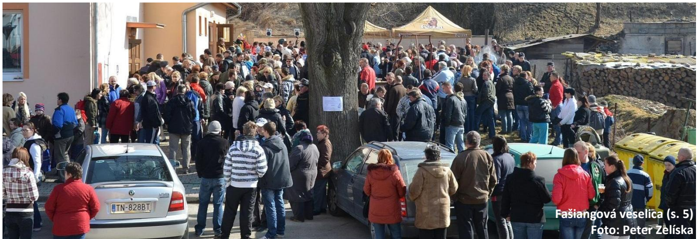
Fašiangová veselica (s. 5)

» Uznesenia samosprávy (s. 2) » Rekonštrukcia kostola (s. 3) » Kultúrny život (s. 5) » Škola nielen o škole (s. 7)