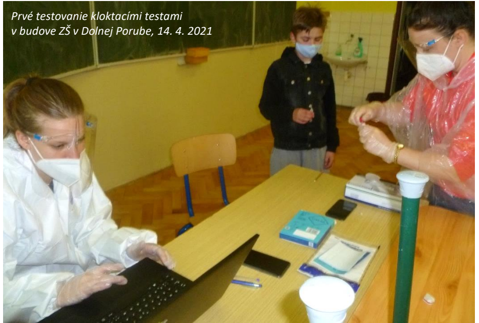
Prvé testovanie kloktacími testami v budove ZŠ v Dolnej Porube, 14. 4. 2021

škola. Ministerstvo ale potvrdilo, že uprednostnilo deti zo sociálne znevýhodneného prostredia, čo sa netýka žiakov v Dolnej Porube.