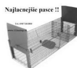
Najlacnejšie pasce !!