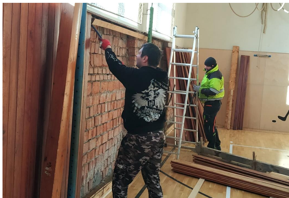
▲ Brigáda v rámci rekonštrukcie interiéru telocvične.