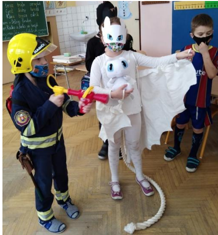
Z karnevalu sa opäť tešili aj žiaci 1. a 3. ročníka.