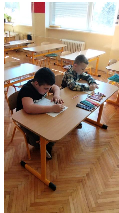
K tradičným udalostiam v rámci výchovno-vzdelávacieho procesu v jarnom období patrí zápis detí do 1. ročníka ZŠ. Tohtoročný zápis sa uskutočnil sa v stredu, 12. 4. 2023.