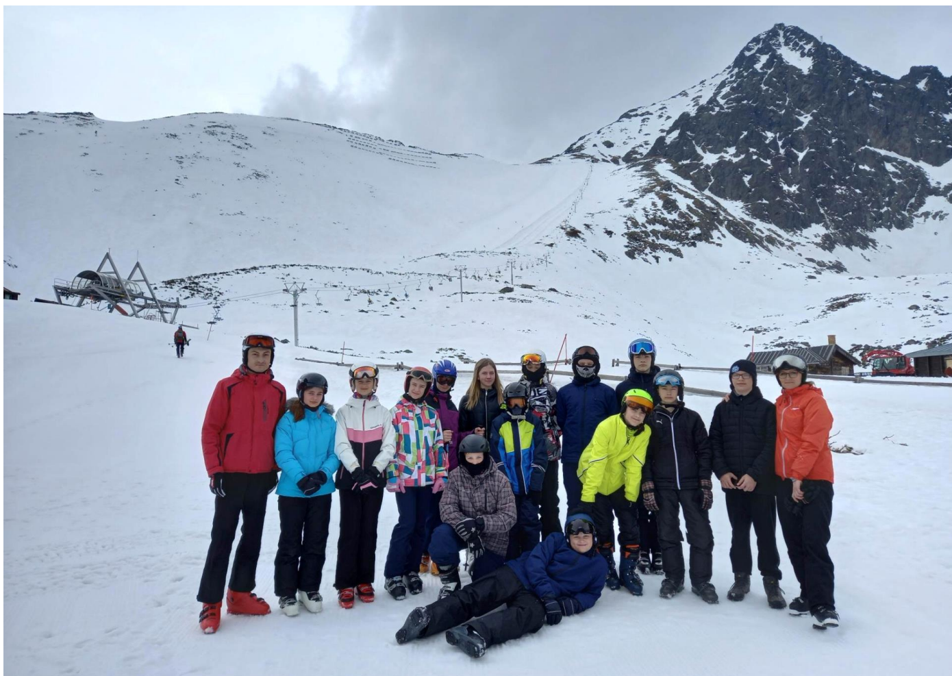
Spoločná fotografia žiakov ZŠ Dolná Poruba – tohtoročných absolventov lyžiarskeho výcviku v Tatranskej Lomnici. ► Foto: archív ZŠ s MŠ DP