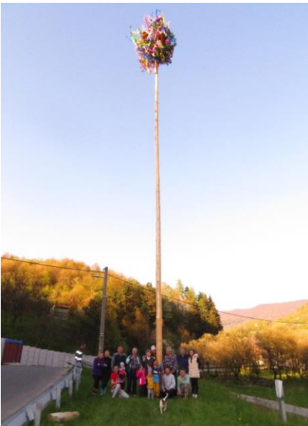
▲ Stavanie mája v časti U Bežákov ▼ Stavanie mája v časti U Suchých