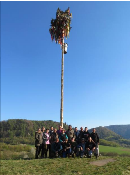
Stavanie mája v lokalite Na Bani