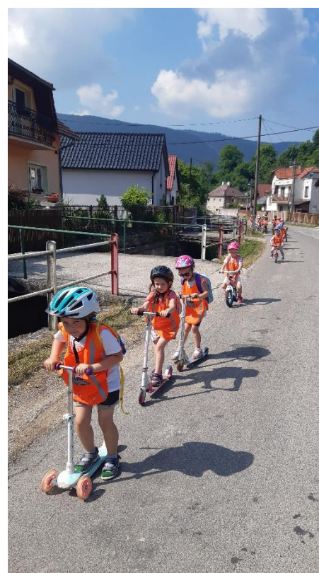
Škôlkari absolvovali výlet na kolobežkách po obci.