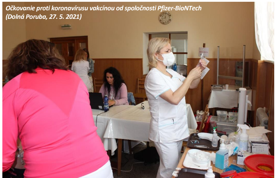
Očkovanie proti koronavírusu vakcínou od spoločnosti Pfizer-BioNTech (Dolná Poruba, 27. 5. 2021)