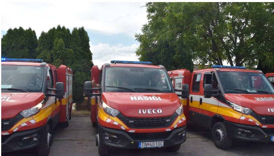
Dobrovoľní hasiči z Dolnej Poruby so svojim novým vozidlom pomohli zabezpečiť vydarený štart 58. ročníka Medzinárodných dní cyklistiky v Trenčianskych Tepliciach (16. 7. 2021).