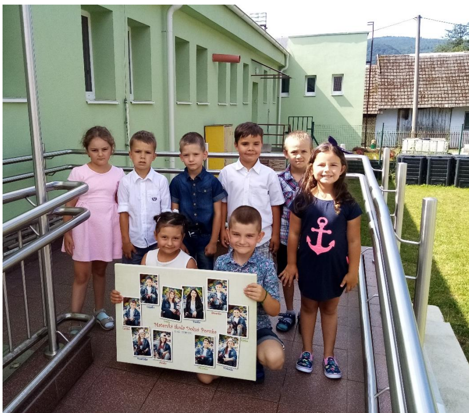
Predškôlci s tablom, s ktorým predstúpili pred starostu obce. Vystavené je pred obecným úradom.