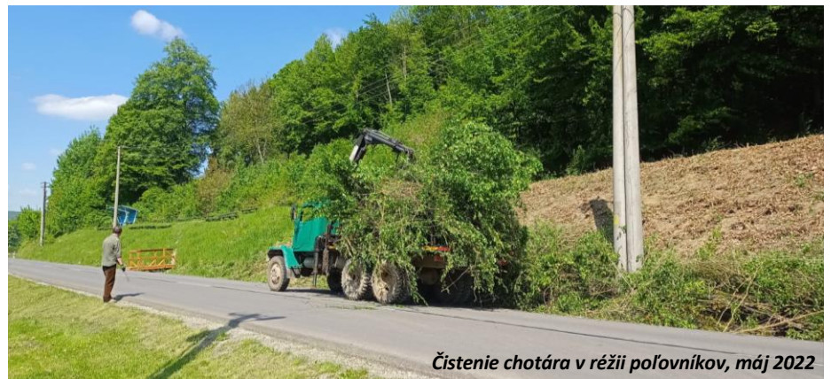
Čistenie chotára v rézii poľovníkov, máj 2022