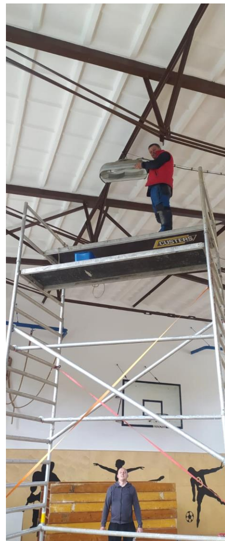
▲ Výmena osvetlenia v telocvični ZŠ