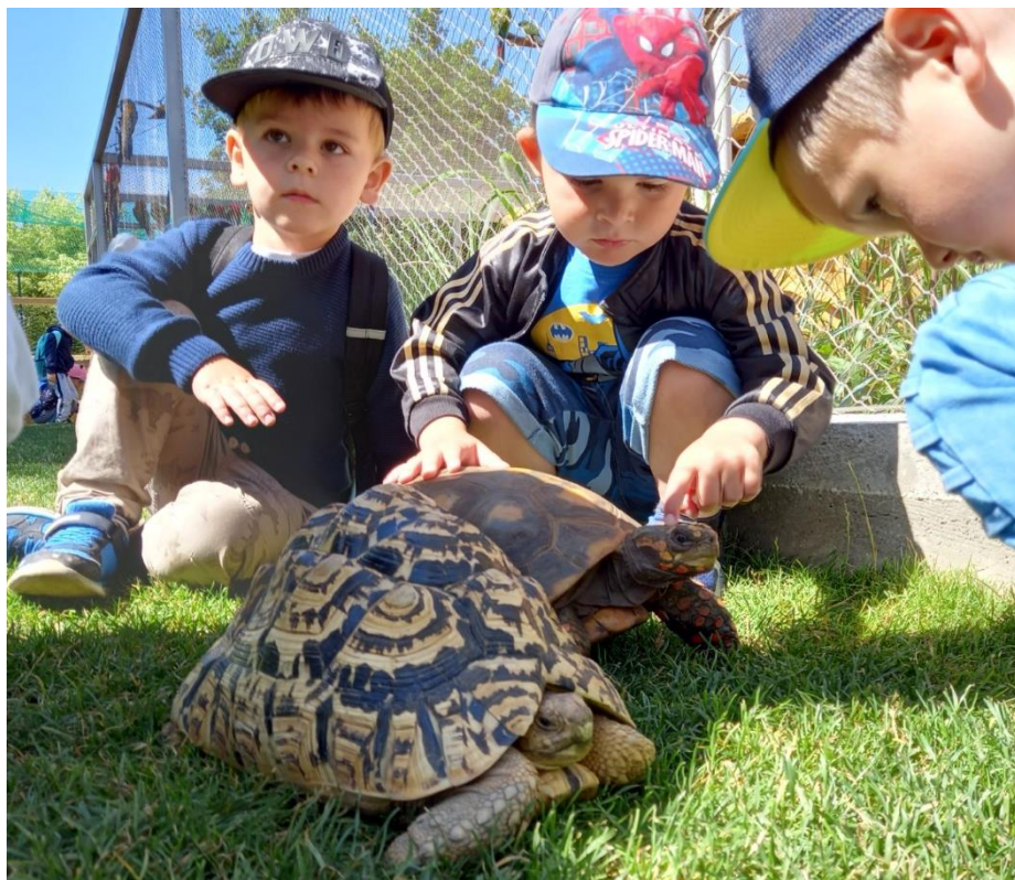
▲ Koncoročný výlet žiakov materskej školy v Eko parku Piešťany