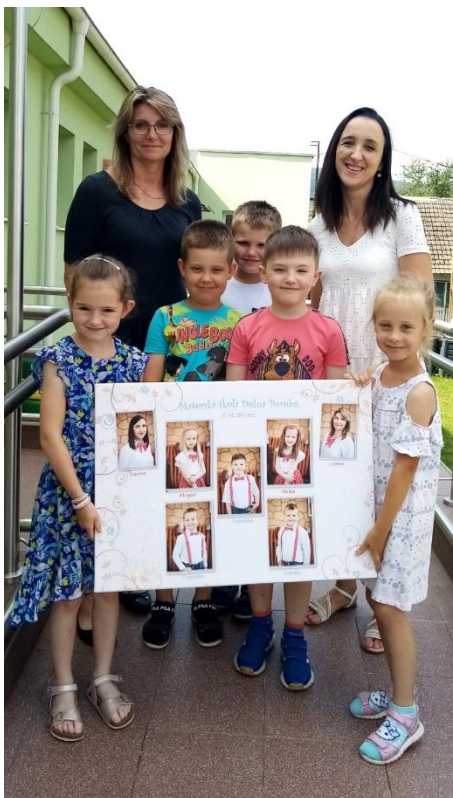
▲ Rozlúčka s predškoolákmi v MŠ