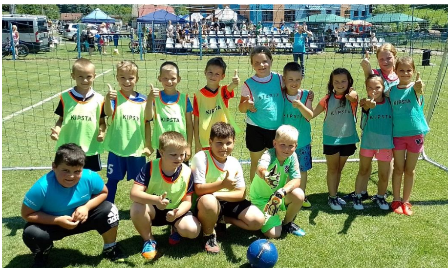
▲ Výber žiakov (kategória U9), ktorí absolvovali futbalovú premiéru proti rovesníkom z Omšenia