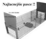
Najlacnejšie pasce !!