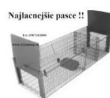
Najlacnejšie pasce !!