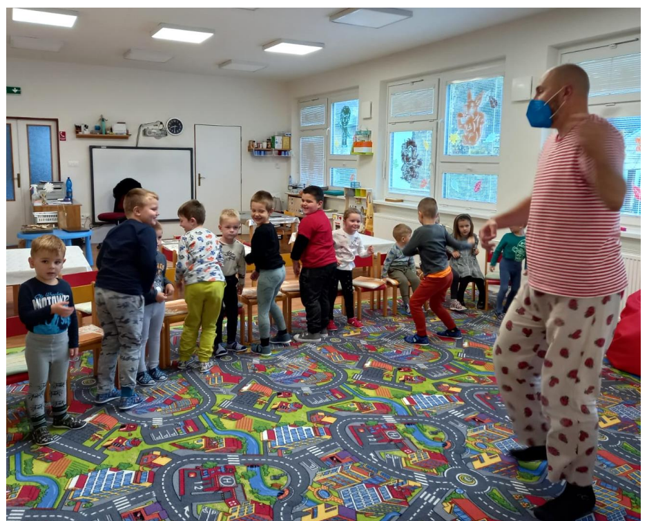
▲ V októbri sa škôlkari tešili z tematického divadielka v priestoroch materskej školy v Dolnej Porube.