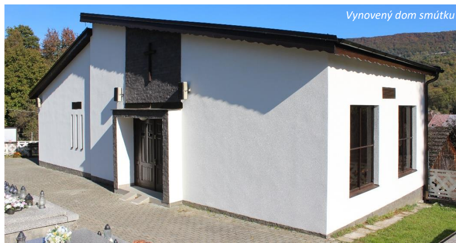
Vynovený dom smútku