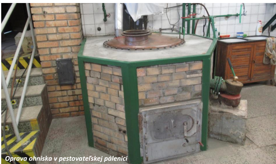
Oprava ohniska v pestovateľskej pálenici