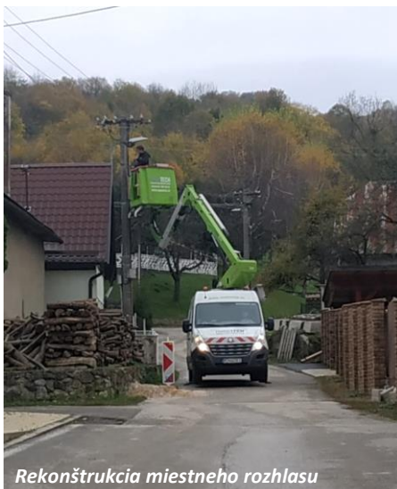
Rekonštrukcia miestneho rozhlasu

Popri kultúrnom vyžití sme sa v obci venovali stavebným prácam na odstránení havarijného stavu hlavných schodov do základnej školy, kompletnej rekonštrukcii miestneho rozhlasu, pri ktorej bolo zdemontované staré vedenie rozhlasu vrátane reproduktorov.