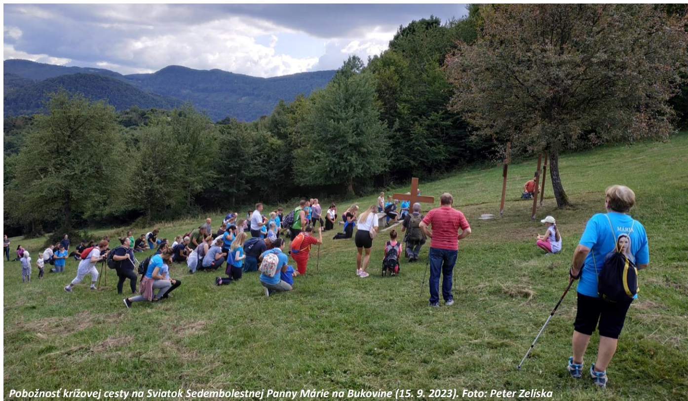
Pobožnosť krížovej cesty na Sviatok Sedembolestnej Panny Márie na Bukovine (15. 9. 2023).