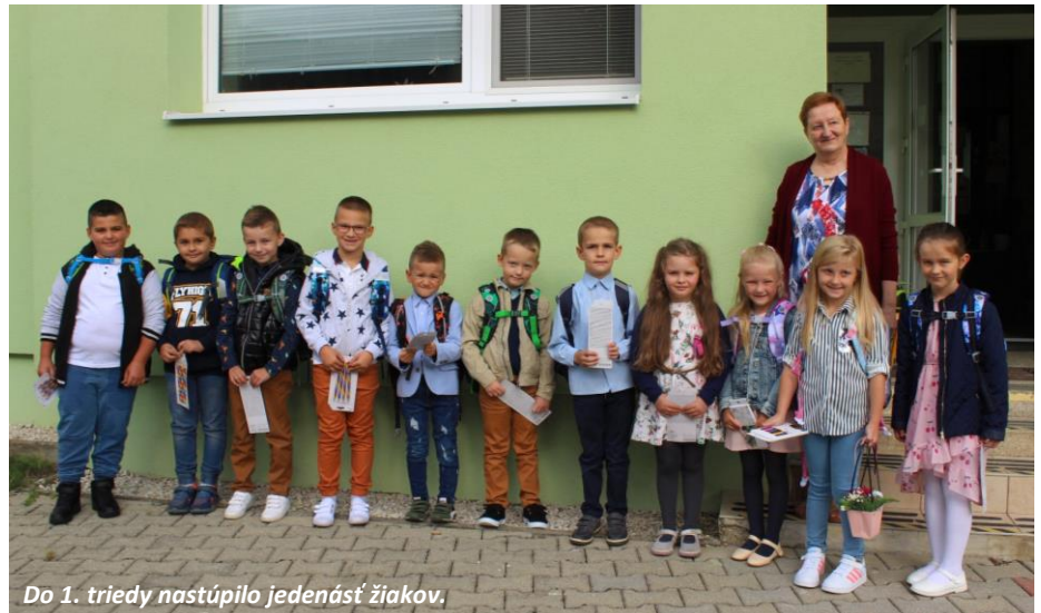
Do 1. triedy nastúpilo jedenásť žiakov.

Všetci sa veľmi tešíme, že v tomto školskom roku budeme môcť naplno využívať aj našu telocvičňu, keďže na jar tohto roka v spolupráci