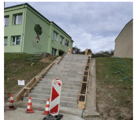
▲ ▼ Obec pristúpila k rozsiahlej oprave schodov do základnej školy a financovala ju z vlastného rozpočtu.